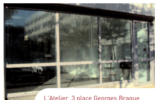
L'Atelier, 3 place Georges Braque