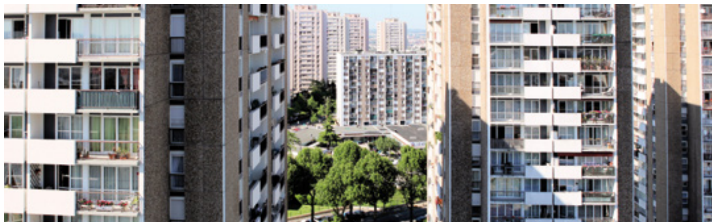
Quartier des Sentes - Les Lilas

Après avoir désigné les entreprises en charge des travaux, les sociétés SEGEX et ELICE , nous sommes actuellement en phase de préparation de chantier.