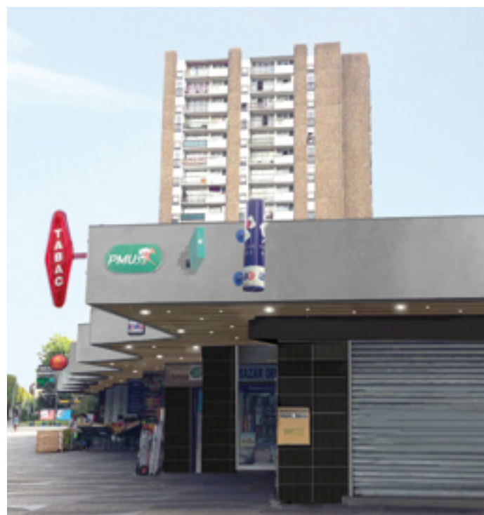
Requalification de la façade du centre commercial