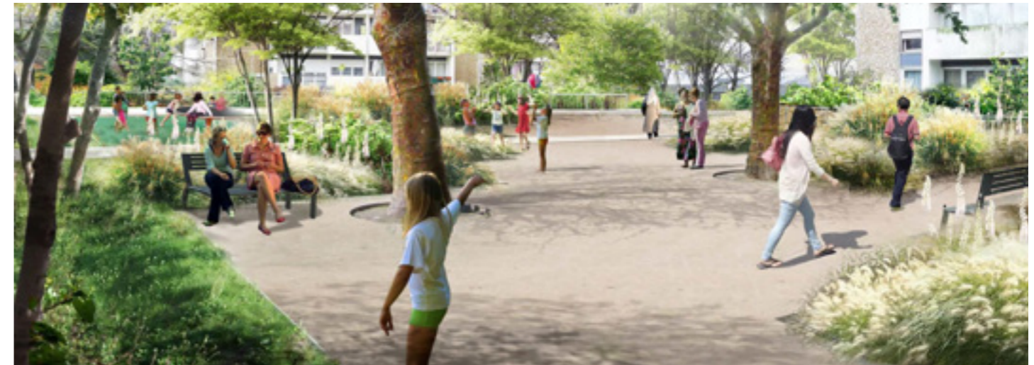
Perspective jardin Calmette - Quartier des Sentes aux Lilas

Après avoir désigné les entreprises en charge des travaux, les sociétés SEGEX et ELICE , nous avons procédé aux ajustements nécessaires à la reprise d'un rythme plus actif du chantier.