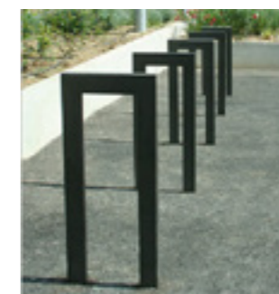
Arceaux à vélo