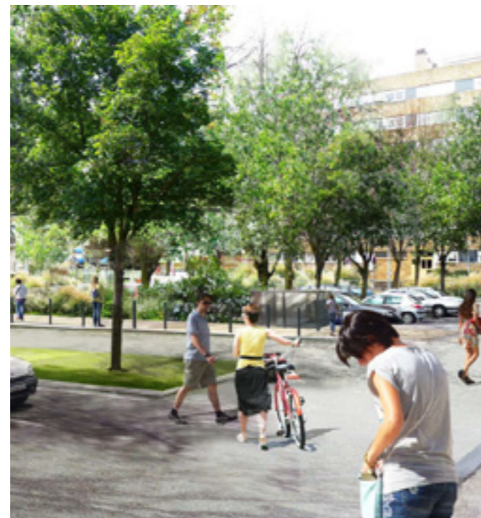
Perspective parking Dunant - Quartier des Sentes aux Lilas