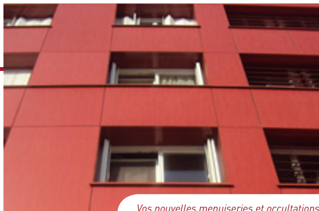
Vos nouvelles menuiseries et occultations.