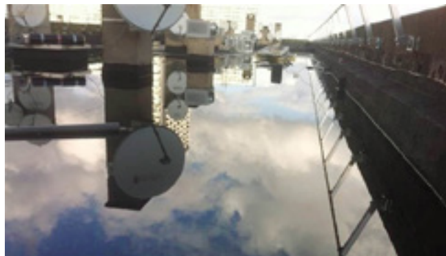
Terrasse du 9 place Georges Braque lors de son test de mise en eau.