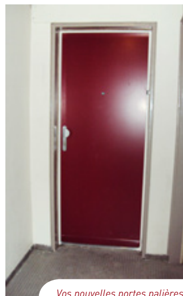
Vos nouvelles portes palières.

Contact : Point d'accueil au 37, rue Beaufils - Tél. : 01 48 36 61 84