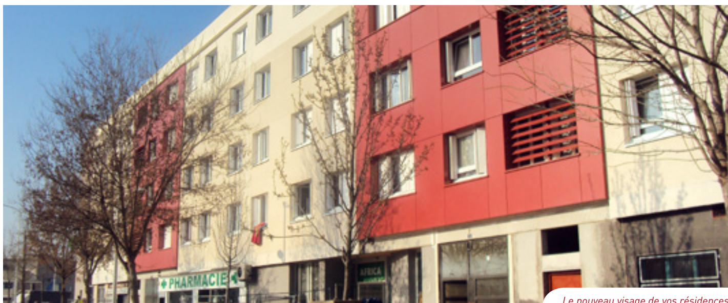
Le nouveau visage de vos résidences.