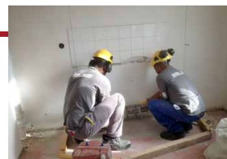
Mise en place du guide pour la scie.