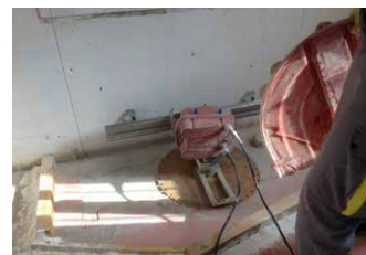
La scie prête à fonctionner.