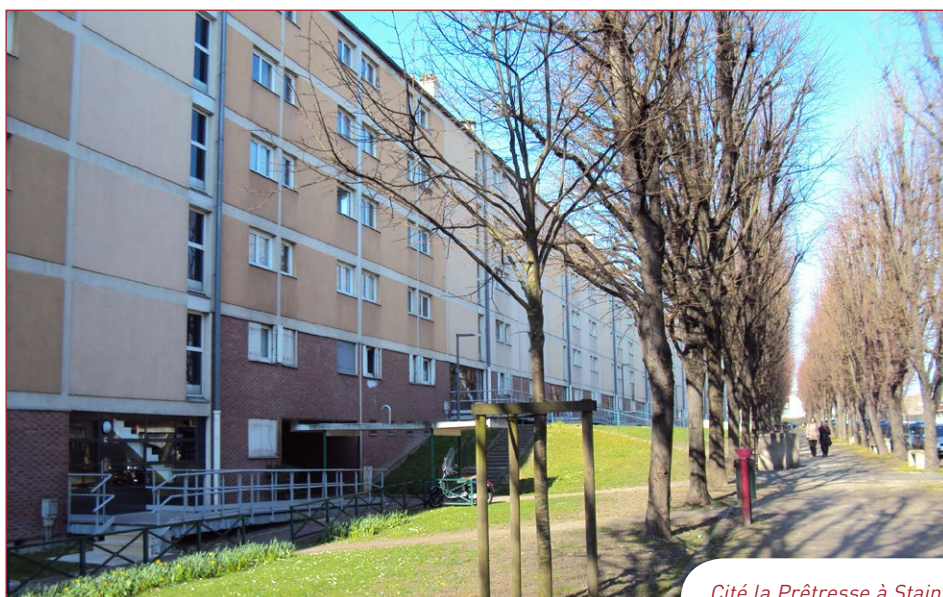
Cité la Prêtresse à Stains

L'inscription de la cité la Prêtresse dans le dispositif du Nouveau Programme National de Rénovation Urbaine est une opportunité exceptionnelle afin de réaliser une opération de réhabilitation.