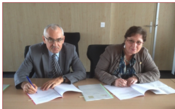
Signature de la convention Oph 93 - Amicale des locataires