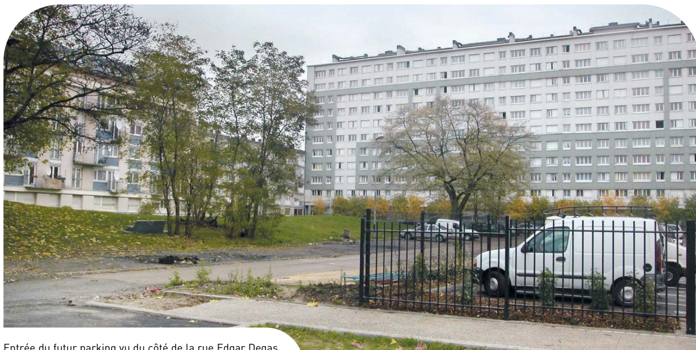
Entrée du futur parking vu du côté de la rue Edgar Degas.