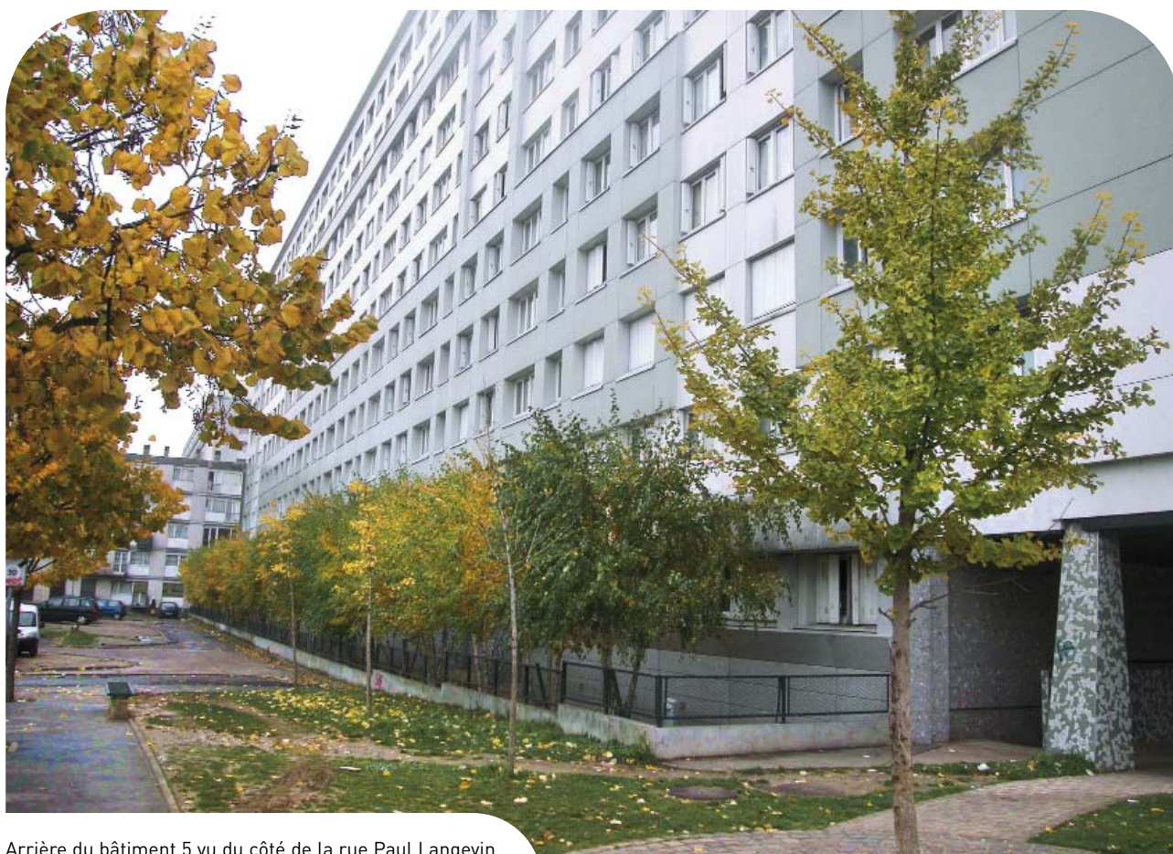
Arrière du bâtiment 5 vu du côté de la rue Paul Langevin.