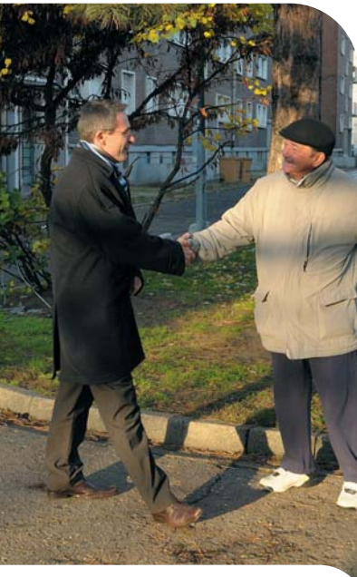
Rencontre avec un locataire de l'Office.

Face à la montée des incivilités et de la petite délinquance qui nuisent tant à la qualité de la vie quotidienne des locataires qu'au travail des agents de l'Office, je souhaite que ce diagnostic soit réalisé dès 2010.