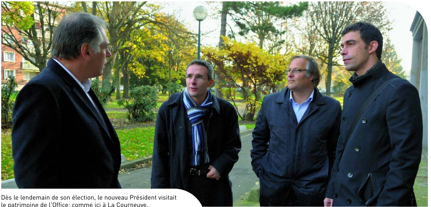
Dès le lendemain de son élection, le nouveau Président visitait le patrimoine de l'Office; comme ici à La Courneuve.