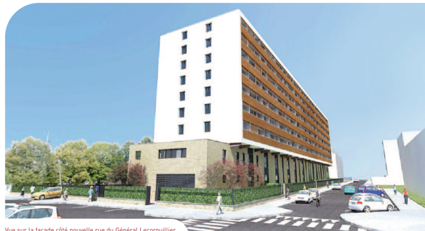
Vue sur la façade côté nouvelle rue du Général Lecorguillier.