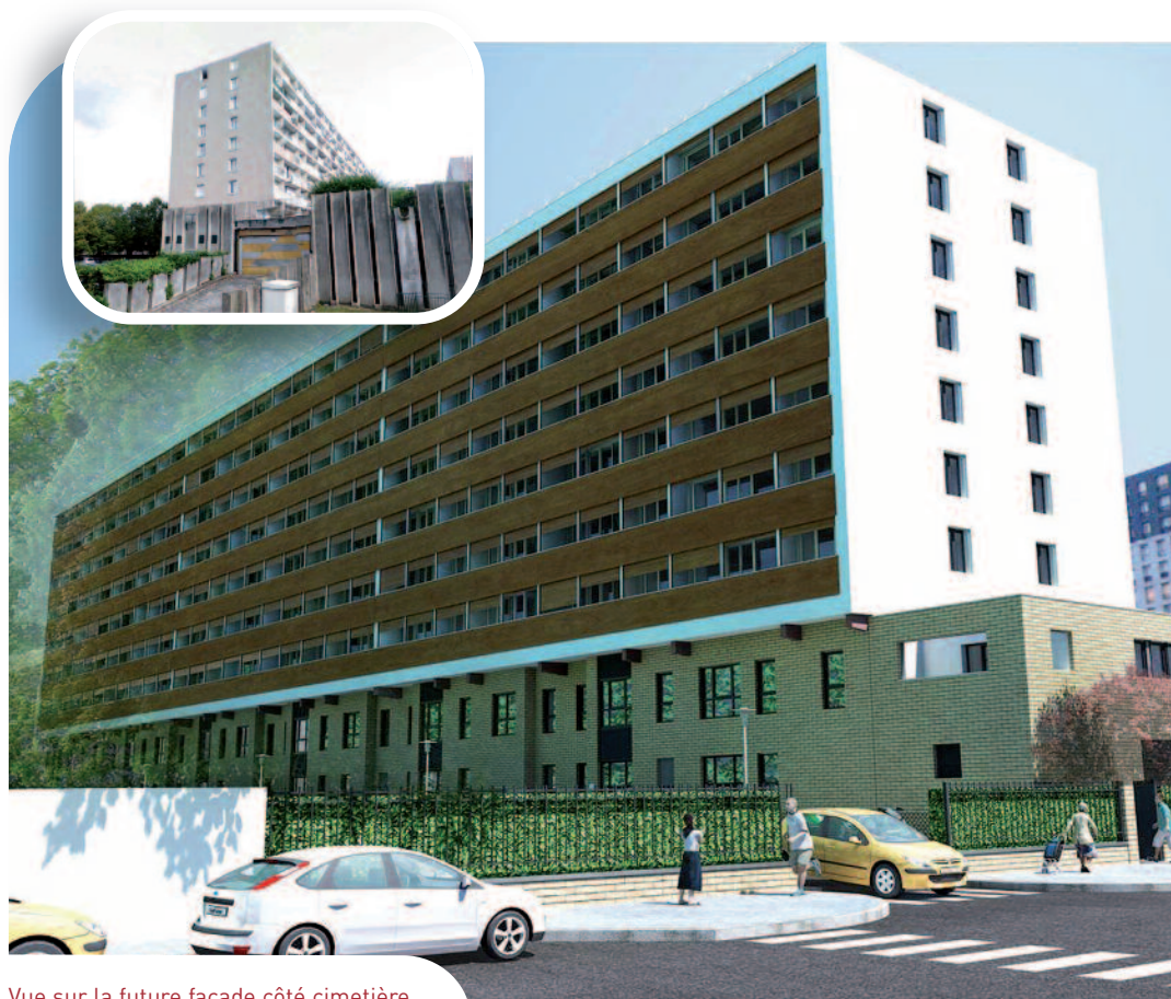
Vue sur la future façade côté cimetière.

Après les phases d'études et de consultation des entreprises, l'Office a signé le 16 décembre dernier le marché de travaux avec l'entreprise DUMEZ - IDF. Les premières interventions dans vos logements concernent la condamnation des vide-ordures, elles commenceront début mars 2011. L'ensemble des travaux s'étalera sur une durée d'environ 18 mois. Dans ce document, vous trouverez différents renseignements importants, qui vous serviront durant toute la période des travaux.