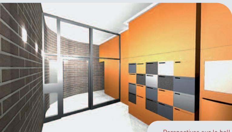
Perspectives sur le hall.