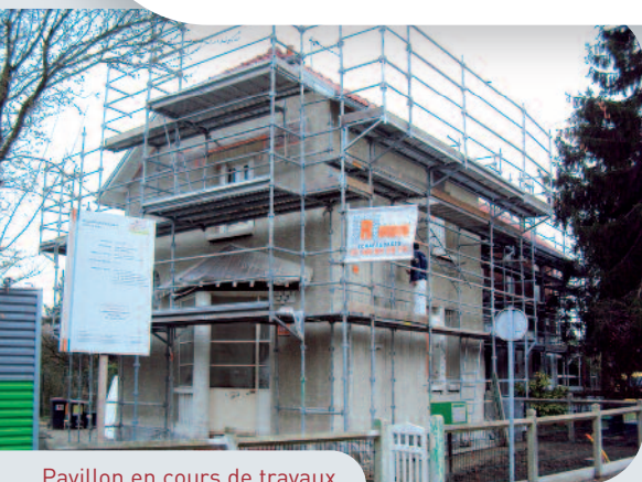
Pavillon en cours de travaux.

Réponse : Recentrer les meubles au milieu des pièces. Tenir compte de la position des prises électriques décidée lors de la visite préalable, notamment avant d'essayer de déplacer les meubles lourds. En cas d'impossibilité d'effectuer ces déplacements (notamment pour des personnes âgées), l'Entreprise vous aidera ou effectuera ces déplacements pour vous. En cas de doute, ayez le réflexe d'appeler M. ANORGA de la société GENERE qui vous donnera tout renseignement nécessaire à cet effet.