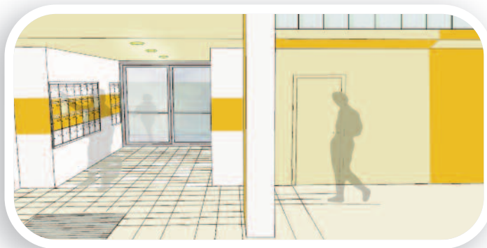
Les futurs halls des tours Claudel et Nerval.

La fin des travaux dans les halls est prévue pour septembre 2011.