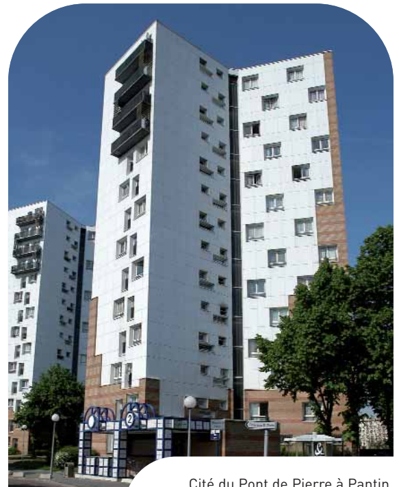
Cité du Pont de Pierre à Pantin.

Les travaux vont se poursuivre par les interventions dans les halls et sur les cages d'escaliers. Nous attirons votre attention sur le fait que, pendant ces travaux, les ouvriers travailleront sur des nacelles, qui se tiendront sur les paliers. Nous vous recommandons donc vivement d'utiliser les ascenseurs, afin d'éviter de circuler à proximité des zones de travaux.