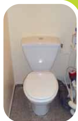
Disposition du WC inchangée.